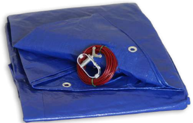
Câble de serrage avec Tendeur inclus / Pool Cover Cable and Winch Kit included

Imaginée et approuvée par notre équipe à Chambéry en Savoie (73).